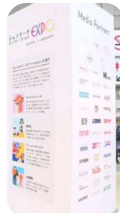
会場設置の様子 (パネル側面)