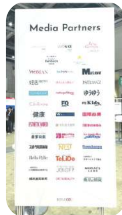
会場設置の様子 (パネル正面)